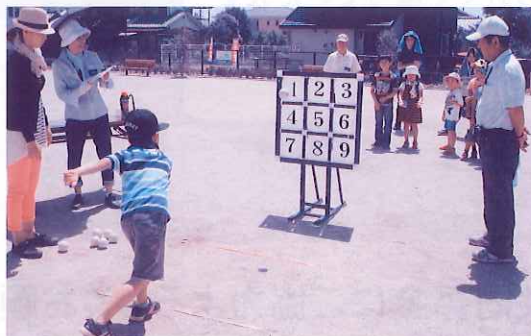
三世代交流事業のようす