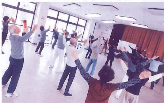
高齢者等サロン事業のようす