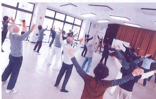
高齢者等サロン事業のようす