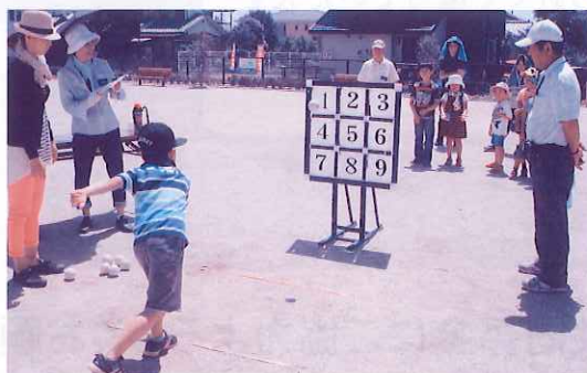
三世代交流事業のようす